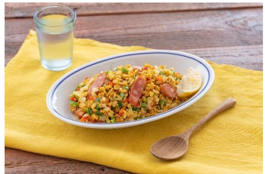
ソーセージカレーピラフ