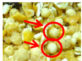
図2)ホワイトクリスプの密度の調節