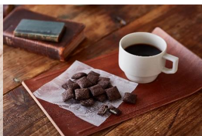
間食にもお楽しみいただけます